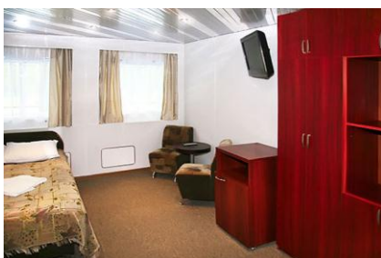
Полулюкс (средняя палуба)