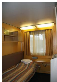
1-местная каюта (средняя, шлюпочная палубы)