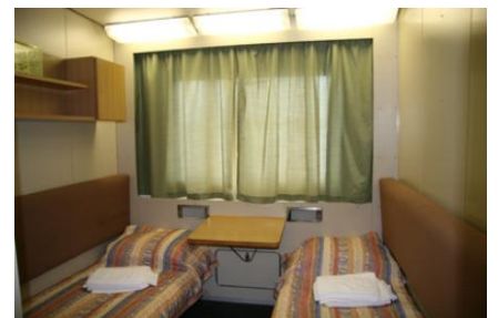
2-местная 1-ярусная каюта (главная, средняя, шлюпочная палубы)