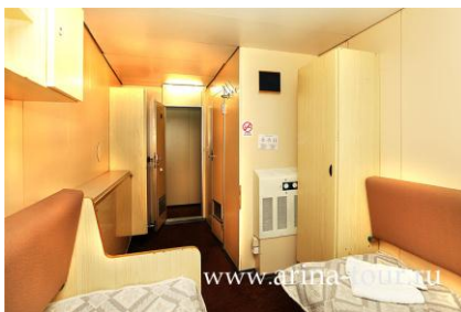
3-местная 1-ярусная каюта (нижняя палуба)