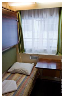
2-местная 2-ярусная каюта (средняя палуба)